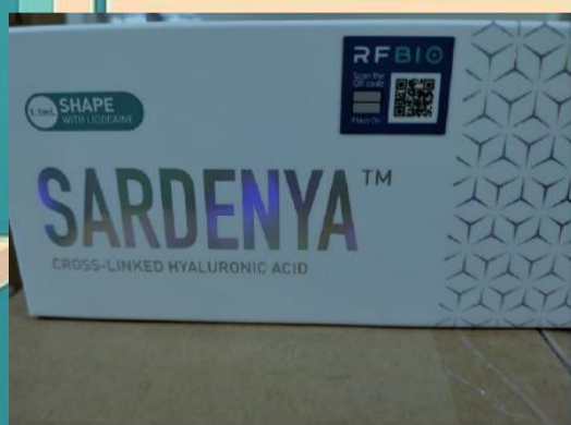
Imagen 1. Producto Original

Producto falsificado o fraudulento , lo cual incrementa el riesgo sanitario consumirlo.