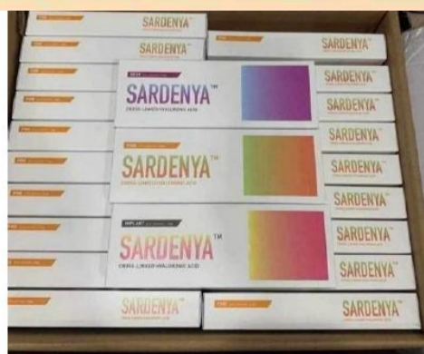
Imagen 2. Producto Fraudulento

Verifica más a fondo la información ingresando al siguiente link